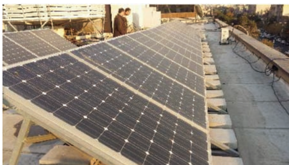
شکل ۳: عدم نظافت دوره‌ای پنل‌ها و وجود گرد و غبار و فضله پرنندگان بر روی آن‌ها

شکل (۴) مقایسه آمار تولید در سال ۲۰۱۶ را با سال ۲۰۱۷ نشان می‌دهد. با توجه به اینکه در زمان اندازه‌گیری، میزان تولید هنوز سال میلادی ۲۰۱۷ به اتمام نرسیده است، بنابراین بدون در نظر گرفتن ماه دسامبر همان‌طور که مشاهده می‌شود، میانگین تولید در سال ۲۰۱۷ به نسبت مدت مشابه در سال ۲۰۱۶ افزایش داشته است. قابل ذکر است که در این پروژه به‌جای استفاده از کابل‌های سولار از کابل‌های معمولی استفاده شده که همین مساله موجب افزایش تلفات و کاهش عمر کابل به دلیل قرار گرفتن در معرض شرایط جوی است. علاوه بر این به‌دلیل عدم رسیدگی مناسب و نظافت پنل‌های خورشیدی، گرد و غبار فراوانی بر روی پنل‌های خورشیدی قرار گرفته بود که این مساله نیز در افت عملکرد نیروگاه مؤثر می‌باشد. به عبارت دیگر در صورتی که عملکرد سیستم تحت شرایط آب و هوایی کاملاً مشابه در دو سال متوالی اندازه‌گیری شود، قطعاً با کاهش راندمان مواجه خواهیم بود.