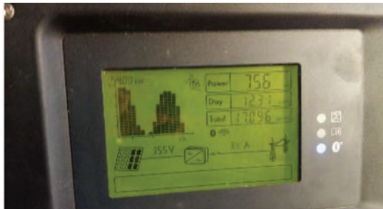
شکل ۱: اطلاعات تولید درج شده بر روی صفحه اینورتر سایت منصوبه

با مراجعه به نیروگاه منصوبه، مجموع تولید از زمان نصب تا لحظه اندازه‌گیری بر روی صفحه اینورتر نشان داده شده است. همان‌طور که از شکل (۱) مشاهده می‌شود، مقدار توان لحظه‌ای نیروگاه در زمان اندازه‌گیری ۷۵۶ وات، میزان انرژی تولیدی کل روز تا زمان اندازه‌گیری ۱۲/۳۱ کیلووات ساعت و میزان کل انرژی تولیدی از زمان راه‌اندازی نیروگاه تا زمان اندازه‌گیری ۱۷/۰۹۶ مگاوات ساعت می‌باشد.