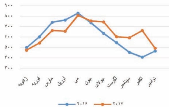
شکل ۴: مقایسه آمار تولید سال ۲۰۱۶ و ۲۰۱۷

در این مورد با مقایسه مقادیر تولید در سال ۲۰۱۶ و ۲۰۱۷ مشاهده می‌شود که انرژی تولید شده به میزان ۲۰۶ کیلووات ساعت افزایش داشته که این مساله به شرایط تابش و تعداد روزهای ابر و باران بستگی دارد.